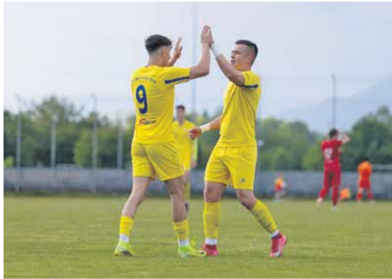
Slaba serija na koncu je Dobljanom odnesla tretji zaporedni naslov.

avtogolom na derbiju proti Šenčurju tri kroge pred koncem, prišle so še težave s poškodbami in enostavno nismo več zmogli ujeti zmagovitega ritma. Ampak nimamo kaj, ne-