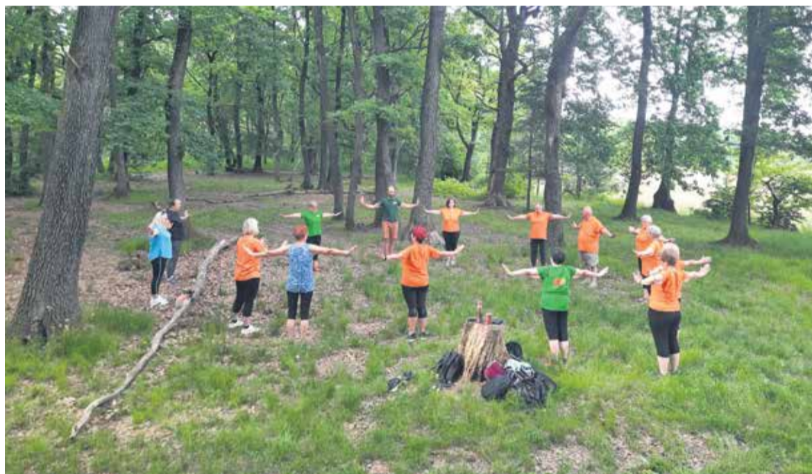
S sproščenostjo in notranjim mirom 'nahrnite' svoje misli in telo.