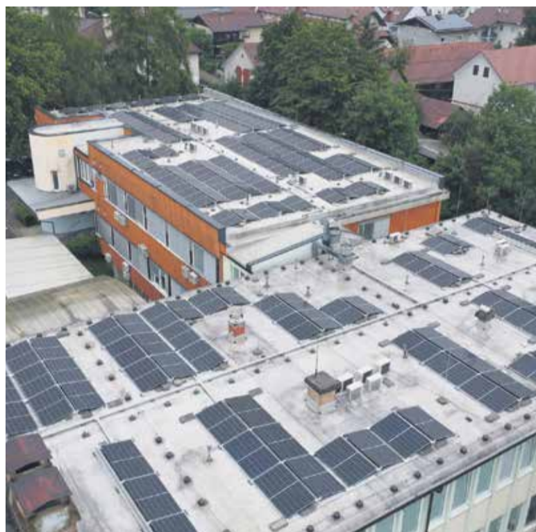
Sončna elektrarna na Zdravstvenem domu Domžale

Cilj projekta je, da se čim več proizvedene električne energije porabi znotraj skupnosti, kar bo prispevalo k boljši izrabi lokalno proizvedene energije in večji odpornosti na nihanja na energetskih trgih. Županja Občine Domžale mag. Renata Kosec ob tem poudarja, da občina z vlaganjem v obnovljive vire energije ureničuje zaveze trajnostnega razvoja ter odgovornega ravnanja z javnimi sredstvi. »S tem projektom ne povečujemo le deleža obnovljivih virov energije, temveč ustvarjamo tudi dolgoročne koristi za javne ustanove in lokalno skupnost,« je izpostavila.