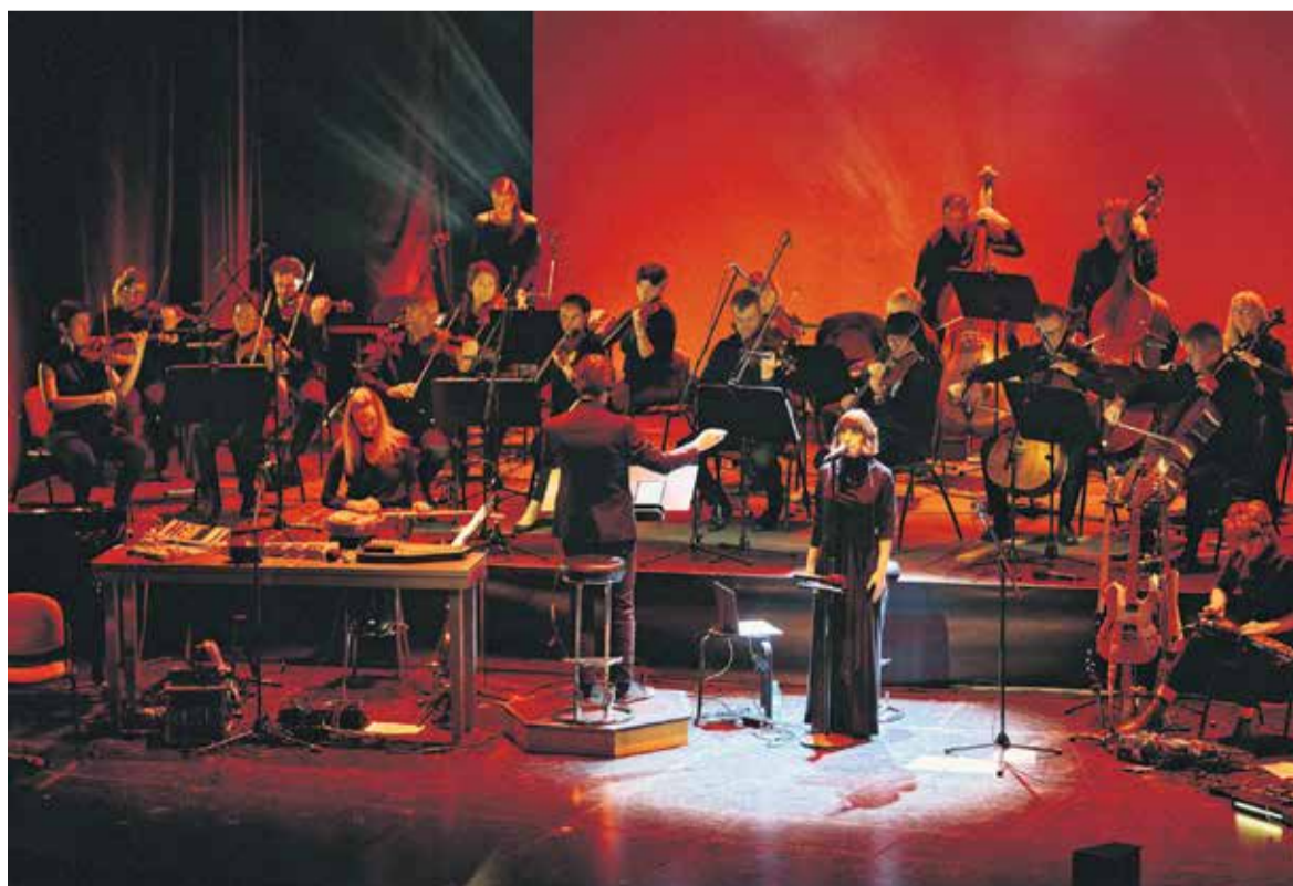
Skupina Liamere med nastopom s člani Simfoničnega orkestra RTV v Cankarjevem domu