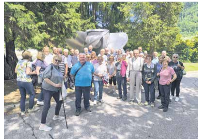
Pred staro turbino v Hidroelektrarni Dravograd