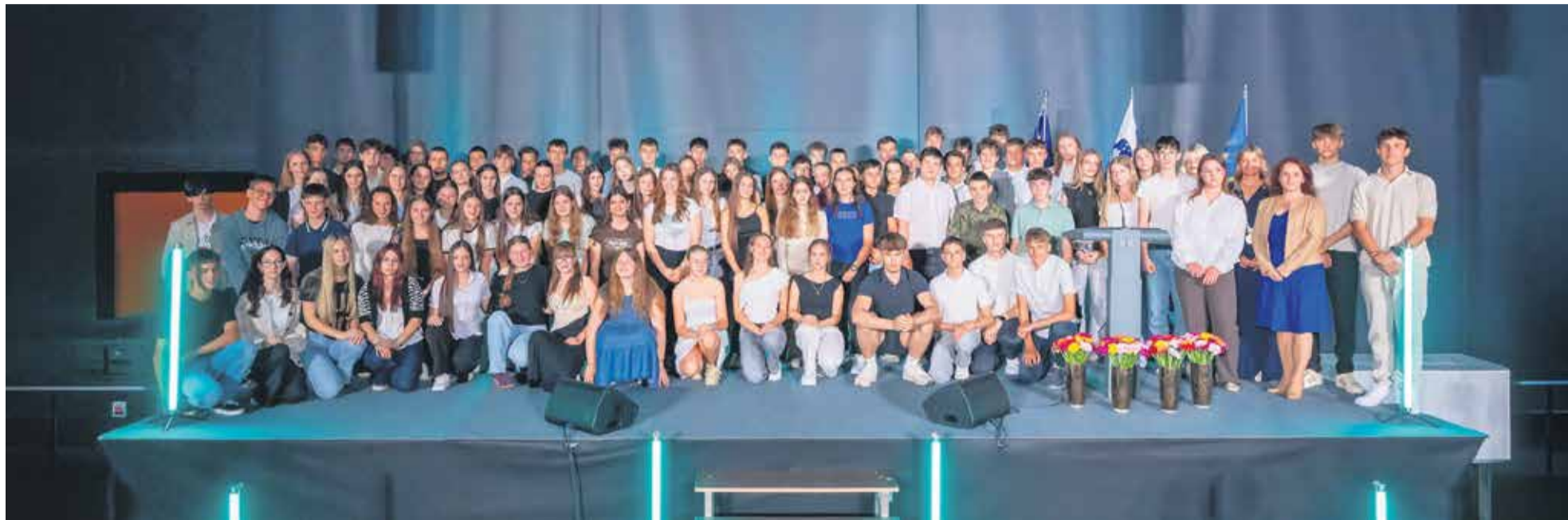
Izjemni učenke, učenci, dijakinje in dijak