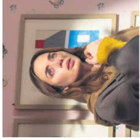
Film: Dan razkritja Mestni kino Domžale, 1. julija