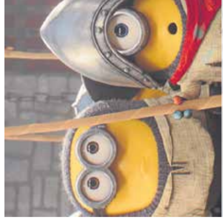
Animirani film: Minioni in pošasti Mestni kino Domžale, 4. julija