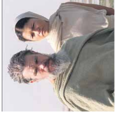
Film: Odiseja Arboretum Volčji Potok, 17. julija