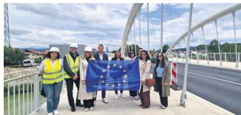
Predstavnica Evropske komisije na obisku v Domžalah