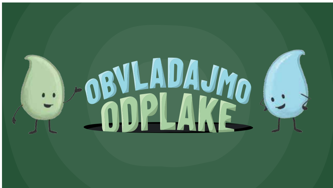
Liki odplak v kampanji Obvladajmo odplake

CČN Domžale-Kamnik, na katero se steka odpadna voda iz šestih občin, je po zmogljivosti četrti največji sistem v Sloveniji (149.000 PE), ki letno prečisti do 9 milijonov kubičnih metrov odpadne vode. Z nadgradnjo od leta 2016 dalje CČN izvaja terciarno čiščenje in iz odpadne vode poleg organskih učinkovito odstranjuje dušikove in fosforne snovi. Z razvojnimi koraki in v skladu z evropskimi okoljskimi smernicami utrjuje svojo vlogo ene tehnološko najnaprednejših naprav v regiji.