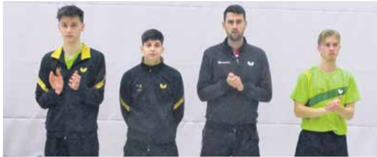
Članska ekipa NTS Mengeš bo tudi v naslednji sezoni tekmovala v elitni, 1. slovenski namiznoteniški ligi.