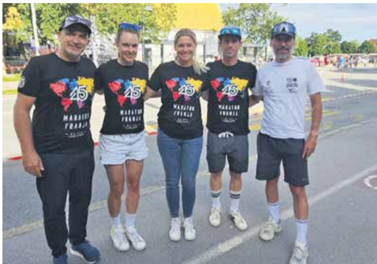
Utrinek s kronometra Maratona Franja