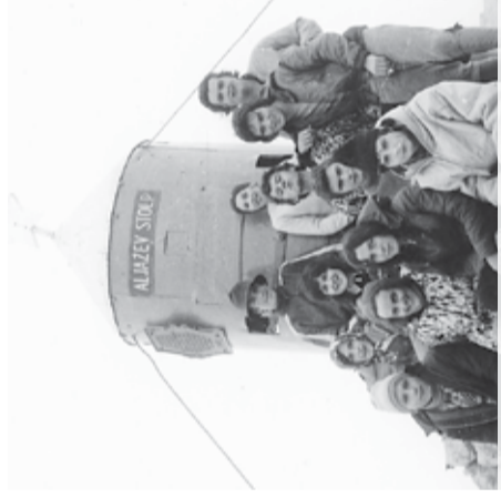
Dokumentarni film: Triglav: pot odrešitve Češminov park, 9. julija