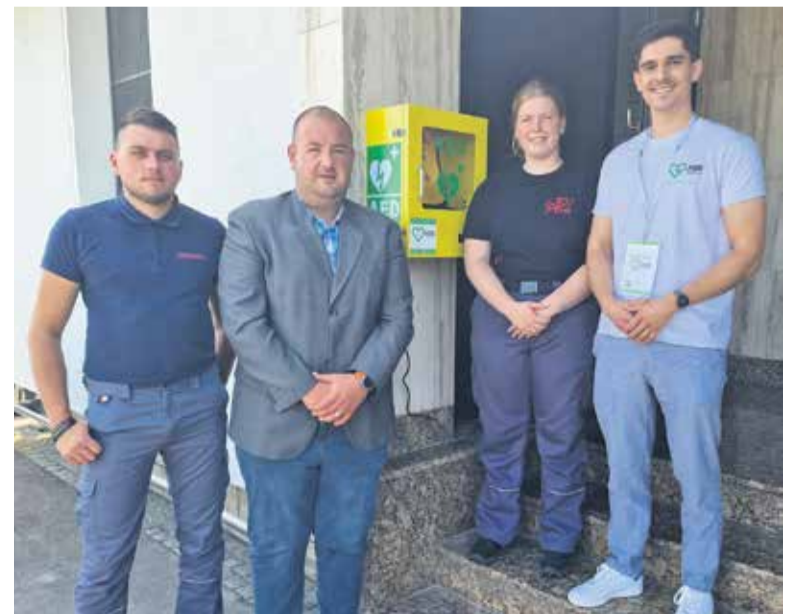
Zemljevid naprav AED v občini Domžale je objavljen na www.domzale.si .