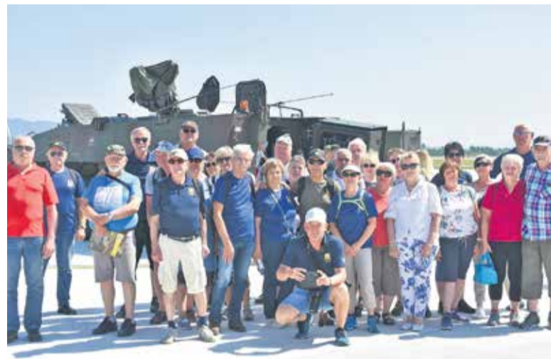
Po zavzetju letališča

Tisti dan so bili na letališču tudi mednarodni pripadniki prijateljskih vojsk, ki so sodelovali na veliki taktični vaji Jadranski udar. Tako smo si lahko ogledali tudi njihova vojaška plovila. Na koncu smo ugotovili, da je Slovenija res majhna država, katere zračni prostor morajo varovati letala sosednje države, kajti s svojo skromno floto v celoti tega ne zmoremo, ali pa lahko le nemočno strmimo v nebo in si mislimo, »tudi vi boste enkrat prišli dol« (potenci-