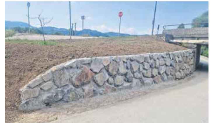
Ureditev podhoda je ena od štirih pobud v sklopu participativnega proračuna na območju KS Dob in Krtina.