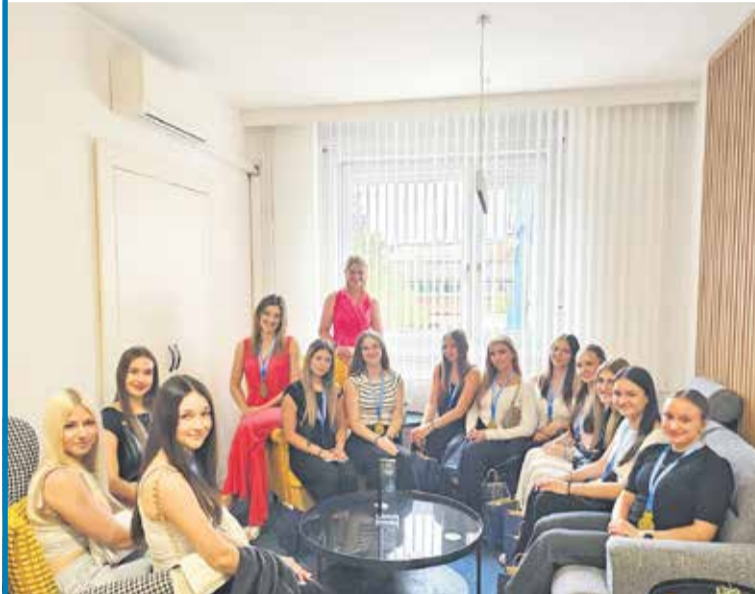
Ob obisku so dekleta delila vtise s tekmovanja, ki je potekalo v Hali Tivoli.