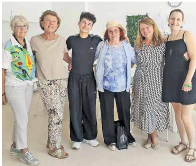
Veselimo se vaše družbe na Ljubljanski cesti 85 v Domžalah.