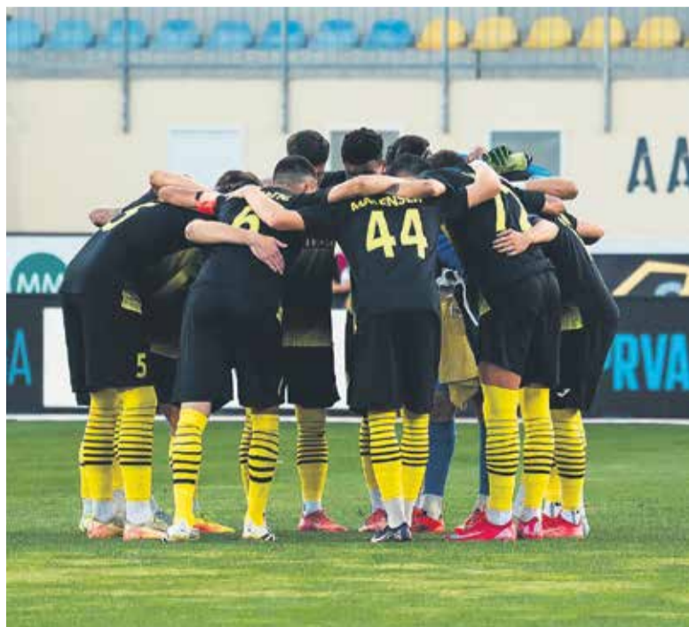
Mlinarji so kljub dobrim predstavam na uvodu (zaenkrat) ostali brez točk.