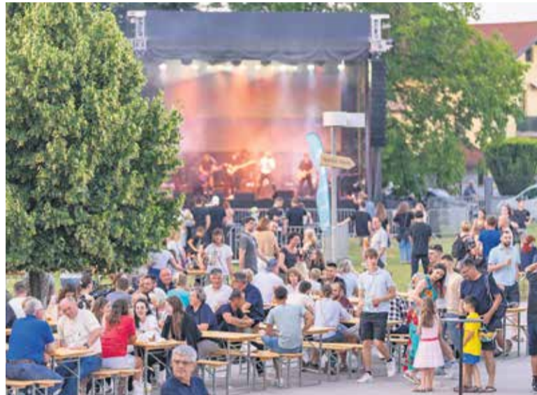
Zaživi poletje z izbrano glasbo in vrhunsko kulinariko