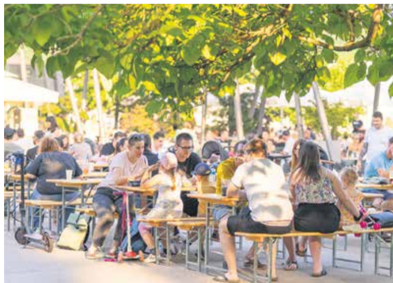
Prvi poletni večer je v park privabil številne obiskovalce.