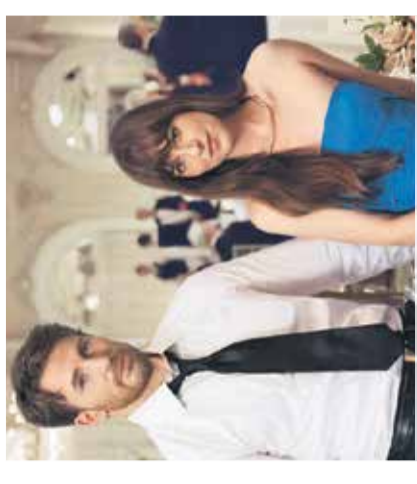
Film: Popolna zveza Arboretum Volčji Potok, 15. avgusta