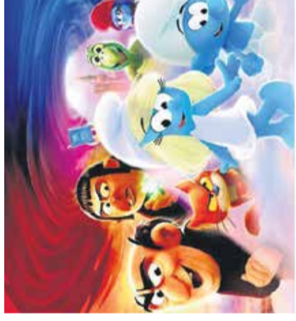
Film: Smrkci Mestni kino Domžale, 5. avgusta