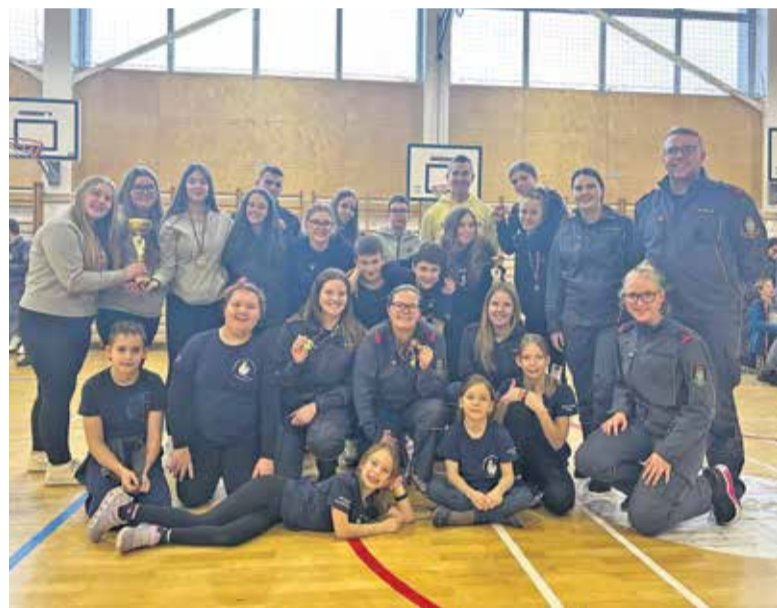
Mladina PGD Rova z mentorji na občinskem gasilskem kvizu

ki iz GZ Domžale. Na smučišču Rudno pri Železnikih sta dve naši mladinki stopili na stopničke, ostali pa so se prav tako izkazali z odličnimi nastopi. Na koncu so seveda najbolj uživali v prosti vožnji in norčijah na progi za najmlajše.