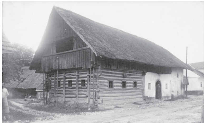
Domačija Pri Kršneču v takratnih Spodnjih Domžalah (danes na Savski cesti) leta 1927