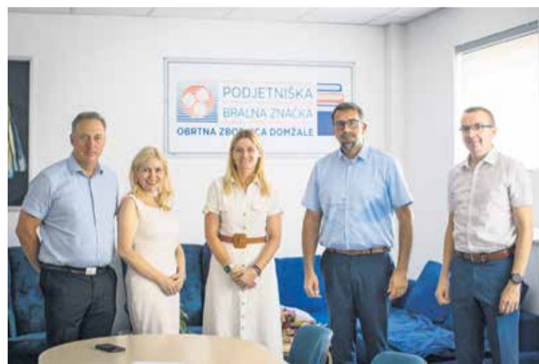
Srečanje je bilo konkreten korak v smeri povezane in razvojno usmerjene lokalne politike.