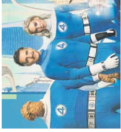
Film: Fantastični štiri: prvi koraki Arboretum Volčji Potok, 2. avgusta