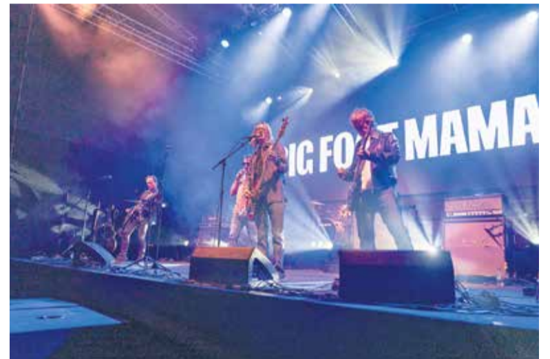
Big Foot Mama so poskrbeli za živahen večer.