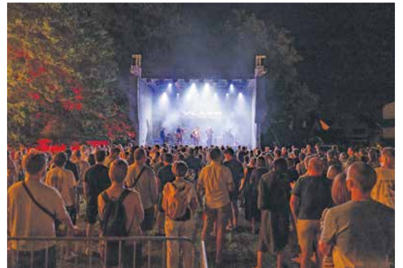
Vlado Kreslin z Malimi bogovi