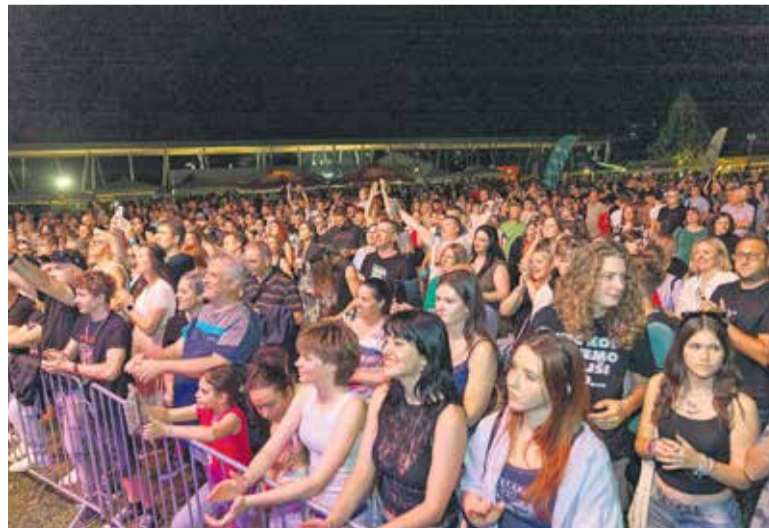
Domžale so Zaživele v poletju.