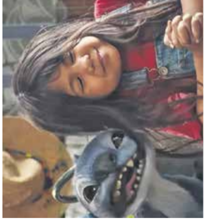
Film: Lili in žverca Mestni kino Domžale, 3. avgusta