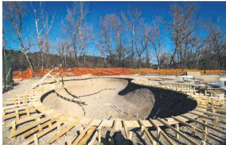
Dela na skateparku nemoteno potekajo.