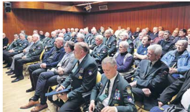
Tradicija ne zamre, pri nas že ne.