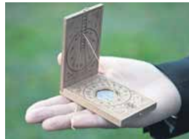
V sončnem vremeni kaže točen čas.

časa ponoči in v dneh brez sonca so uporabljali klepsidro ali vodno uro. Vitruvius, arhitekt in vojni inženir, je v svoji knjigi De architectura opisal klepsidro in dodal seznam znanih ur tistega časa. Agronom Palladius je v knjigi Opus agriculturae eno poglavje posvetil sončnim uram in gnomonu. Objavil je tudi tabelo z dolžino sence. To kaže na pomanjkanje znanja in instrumentov za točno določitev časa. To vrzel so zapolnili Arabci od leta 1000 dalje. Začelo se je novo obdobje sončnih ur, ki so preplavile Evropo. Dosegle so perfekcijo in svojo končno obliko. Z odkritjem mehanskih ur so sončne ure začele izgubljati svojo praktično vrednost, ostale pa so kot priče preteklosti, ko je človek začel stopati proti bolj kultiviranemu načinu življenja.«