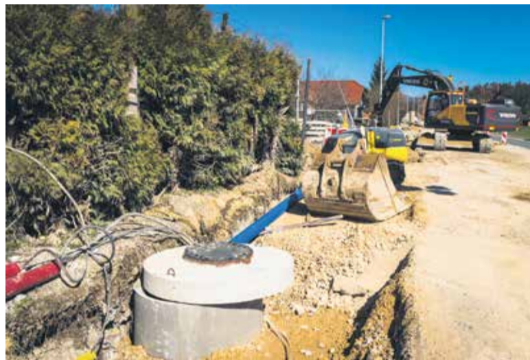
Gradnja kanalizacije in vodovoda na Želodniku