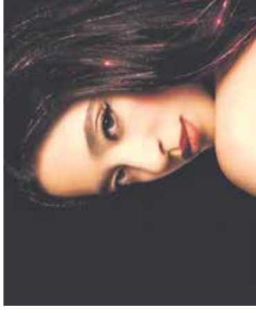
Film: Anora Mestni kino Domžale, 4. aprila