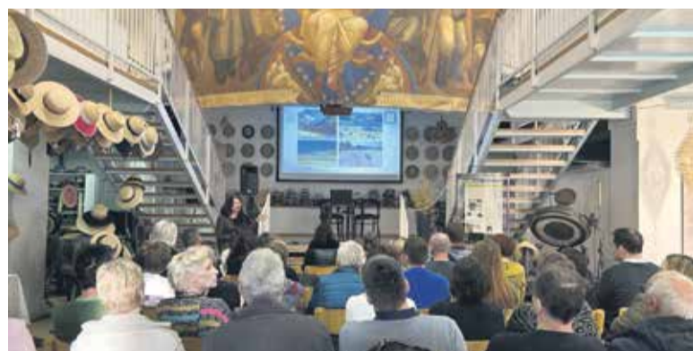
Povezovanje turističnih ponudnikov v občini Domžale