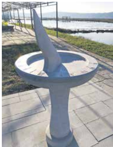
Pitnik – sončna ura v Sečoveljskih solinah