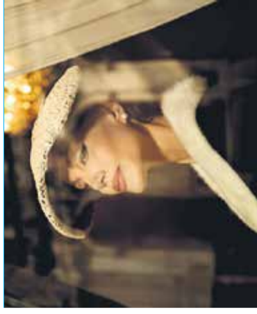
Film: Maria Mestni kino Domžale, 2. aprila