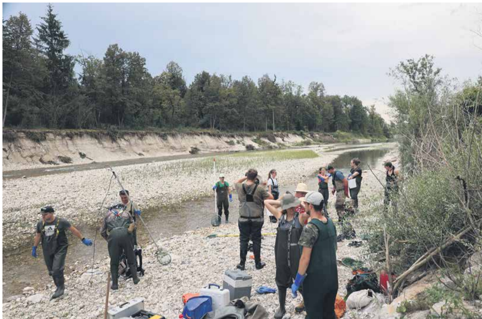
Ekipa Inštituta Revivo je v sodelovanju z Ribiško družino Bistrica Domžale izvedla monitoring rib v Kamniški Bistrici.

V raziskavi smo zabeležili štiri družine rib z desetimi vrstami, od katerih je ena tujerodna. Med vrstami so bili lipan, potočna postrv, šarenka, sulec, blistavec, klen, mrena, navadni globoček, pisanka, pohra, rečna babica in barjanski kapelj. Glede na hudourniški značaj Kamniške Bistrice preseneča, da med zabeleženimi vrstami prevladujejo krapovci. Na obeh merilnih mestih