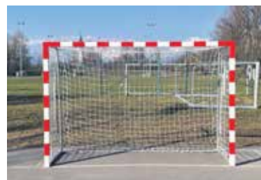
Športna oprema v Športnem parku Vir