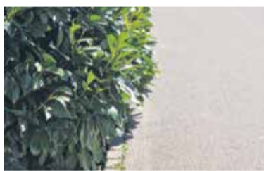
Poskrbimo, da žive meje in drugo rastlinje ne bo segalo na javne površine.

Občinski inšpektorat Občine Domžale želi ob tej priložnosti občanke in občane opozoriti na pomembnost vzdrževanja vegetacije ob javnih površinah, še posebej ob cestah, pločnikih in križiščih. Zaradi varnosti vseh udeležencev v prometu je namreč ključnega pomena, da rastlinje ne sega na prometne površine in ne ovira preglednosti.