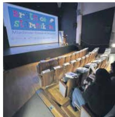
S strokovnim srečanjem so odprli že 15. Bralnice pod slamnikom.