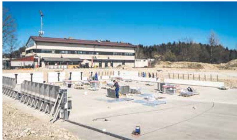
Namešča se bazenska školjka.