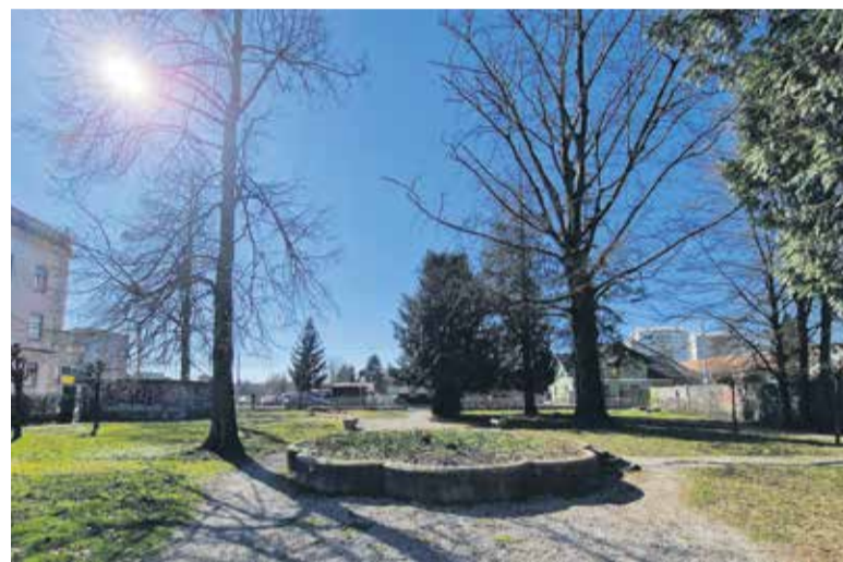
Odstranjeni drevesi bomo nadomestili z novimi.