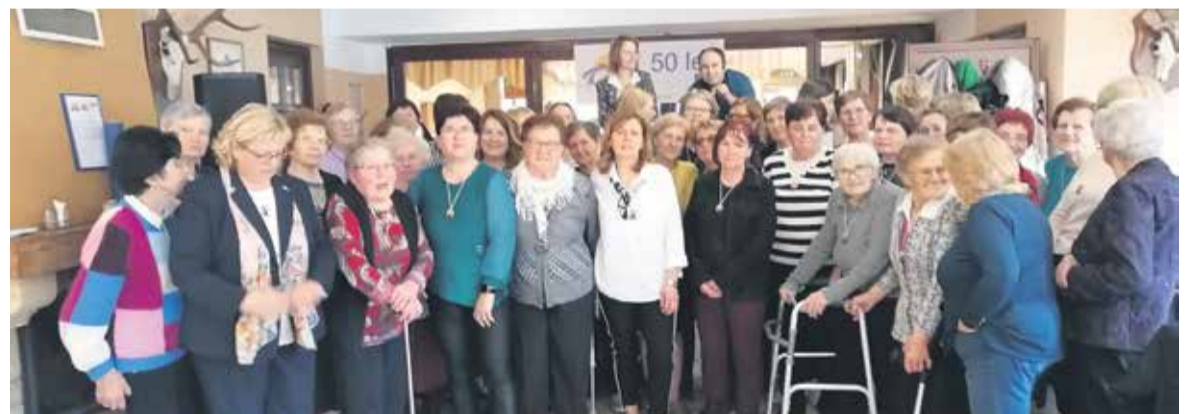
Pogled na del udeleženk slovesnosti

druga drugi in tudi tako skušajo najti lažje življenje. Ob koncu se je zahvalila vsem ter še enkrat poudarila, da je prihodnost društva odvisna od vseh, dejanj, ravnanj in povezovanj ter nagovor zaključila z besedami: »Vsega tega si želimo tudi v prihodnje, kjer nas bo vzpodbujalo tudi srebrno priznanje naše občine, ki se ji lepo zahvaljujemo za vso pozornost in pomoč ob našem zlatem jubileju.«