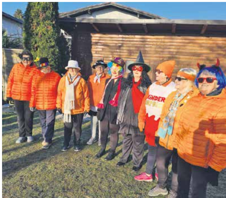
Tradicija ne zamre, pri nas že ne.