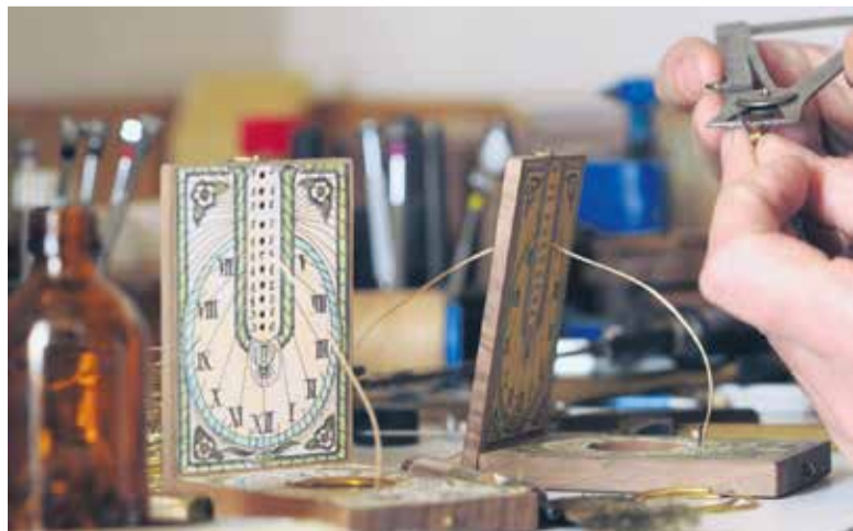
Izdelava potovalne sončne ure

Boštjana Pavliča ima veliko načrtov za prihodnost. Če ne bi bilo finančnih omejitev, pa bi imel urarno po vzoru tistih, ki jih je videl v tujini – velik prostor, kjer bi se v steklenem rastlinjaku svojemu delu posvečali trije ali štirje urarji, okoli njih pa bi tiktakale ure, zanj najlepša melodija. □