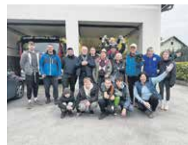
KS Vencija Perka