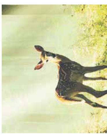
Dokumentarni film: Bambi Mestni kino Domžale, 12. aprila