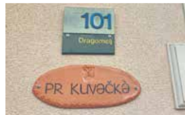
Domačija Pri Kovačku v Dragomlju

Tekom naslednjega koraka v občini Domžale bodo zbrana in obeležena stara hišna imena na območju Domžal (nekdanja naselja Stob, Spodnje in Zgornje Domžale) ter Zaboršta in Depale vasi. V fazi zbiranja imen bodo ta raziskana v zgodovinskih virih (župnijske knjige in zgodovinski katastri), popisana s pomočjo starejših domačinov ter predstavljena in preverjena na srečanjih z domačini. Zbrana hišna imena bodo nato obeležena na že prepoznanih lončenihih tablah na hišah, v knjižni obliki