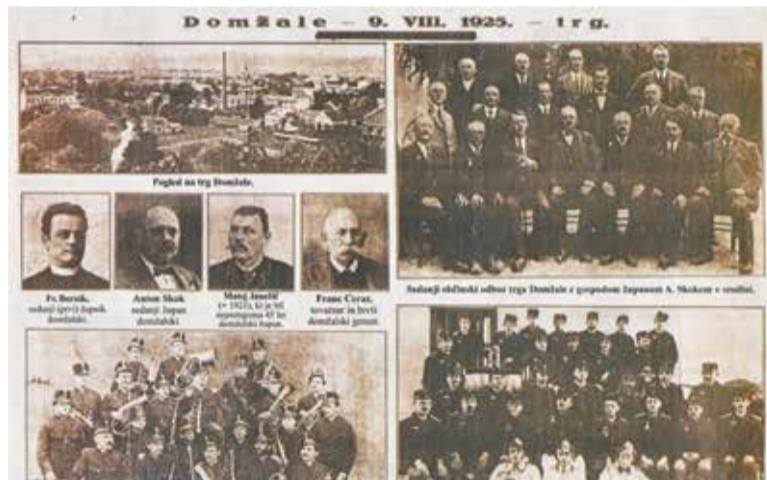
Ilustrirani Slovenec je ob razglasitvi Domžal za trg objavil fotoreportažo.

prireditvi pa se je število udeležencev podvojilo. Iz Ljubljane je okoli 2000 gostov pripeljal posebni vlak. Vrtno veselico jo obogatil nastop domžalske godbe, slammnikarske šivalke pa so udeležencem prodajale svoje izdelke. Županstvo novega trga se je zahvalilo »vsem, ki so pripomogli, da se je proslava razglasitve trga Domžale tako veličastno izvršila«, posebej tudi osrednjemu časopisu, da jo je spremljalo »vestno in z velikim zanimanjem«.