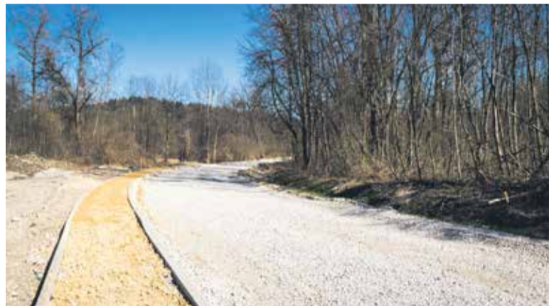
Obnova Preloške ceste v Ihanu