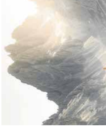
Fotografska razstava na poti Center za mlade Domžale, 10. aprila