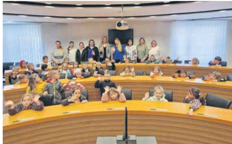
Obisk otrok iz vrtca Urša