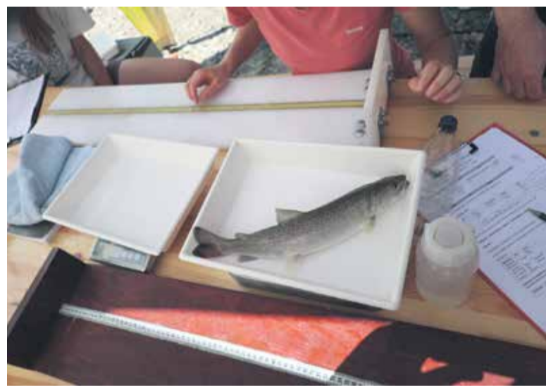
Ujete ribe so natančno stehali in jim izmerili celotno dolžino telesa.

Ribe v tej raziskavi uporabljamo kot kazalnike ekološkega stanja, saj odražajo celokupne vplive in stanje reke kot ekosistema. Da bi bolje razumeli človeške aktivnosti, ki najbolj vplivajo na stanje ribjih združb, pa ob vsakem vzorčenju CČN izmeri tudi kemijske parametre vode v strugi. Letošnje leto je ponudilo izredno zaskrbljujoče rezultate. Parameter, ki se mu reče 'kemijska potreba po kisiku', je npr. določena za iz-