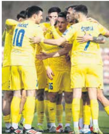
Domžalčani so se veselili prvih zmag po treh mesecih in pol, a čaka jih še veliko dela.