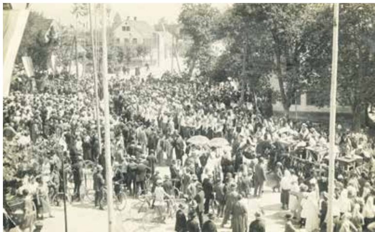
Okrajni glavar je pred kraljevim spomenikom slovesno razglasil Domžale za trg.

Na ustanovitev liberalnega telovadnega društva Sokol v Domžalah leta