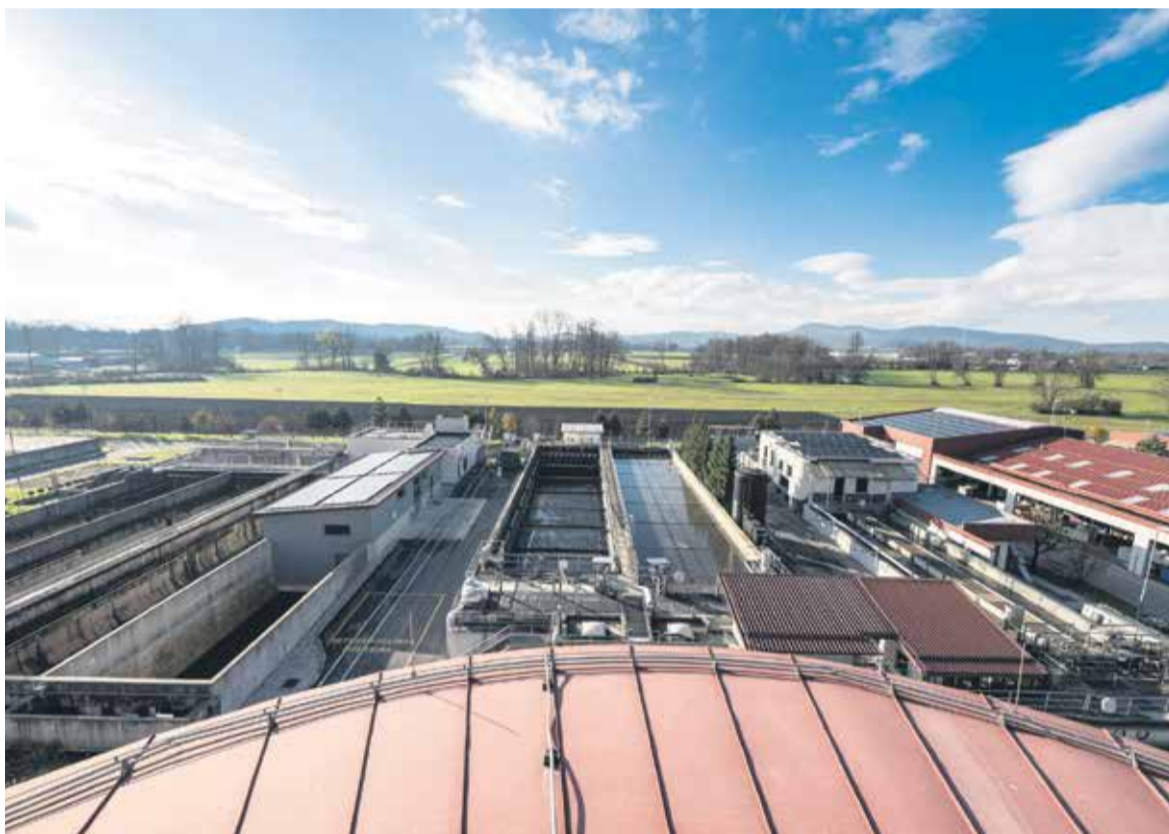
Centralna čistilna naprava Domžale-Kamnik, november 2024