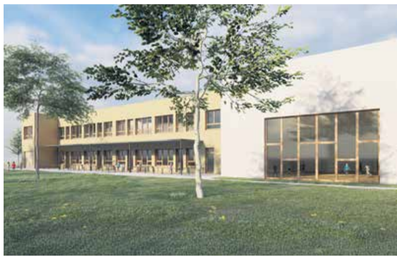
Vizualizacija rekonstrukcije Vrtca Urša, podjetje Misel, d. o. o.

Gradbena dela, katerih začetek je načrtovan v septembru 2025, naj bi trajala do konca leta 2026. Sledijo upravni postopki s pridobitvijo uporabnega dovoljenja. Začetek uporabe novega objekta je predviden od marca 2027 dalje.