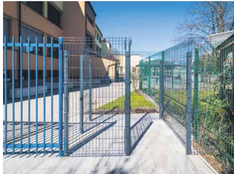
Igriščna vrata pri OŠ Venclja Perka