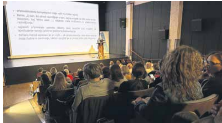
biskovalci strokovnega srečanja so napolnili dvorano KD Franca Bernika Domžale.

Strokovni, navdihujoči in iskriivi prispevki so odprli prostor, razmislek, pogovor, ideje in raziskovanje o tem, kako v svetu, ko knjiga za pozornost mladih 'tekmuje' s številnimi drugimi mediji, branje približati na izvirni in komunikativni način. Odziv strokovne javnosti – knjižničark, knjižničarjev, učiteljic, učiteljev, mentoric in mentorjev branja ter druge zainteresirane javnosti – je bil izjemen, skupno se je strokovnega srečanja udeležilo okrog 90 poslušalk in poslušalcev iz vse Slovenije.