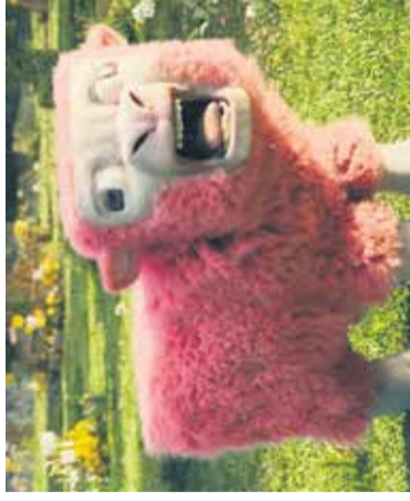
Film: Mincraft Mestni kino Domžale, 4. aprila