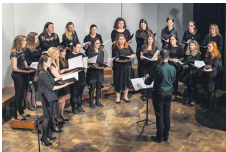
Ženski pevski zbor Moj spev