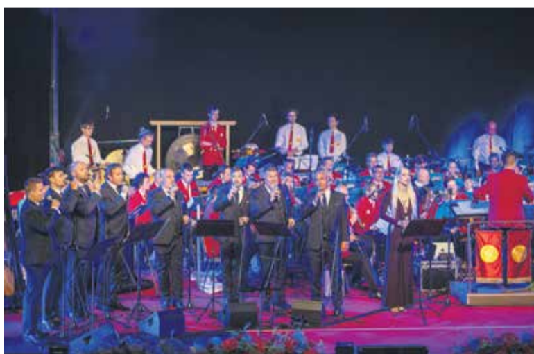
Koncert Srčni mozaik z Raiven in Slovenskim oktetom