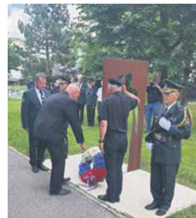
Spominska slovesnost ob obletnici trzinske bitke leta 1991, 27. junija 2024