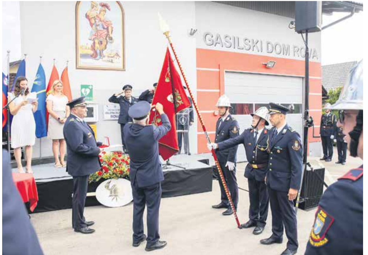
Podelitev gasilskega odlikovanja plamenice druge stopnje društvu PGD Rova