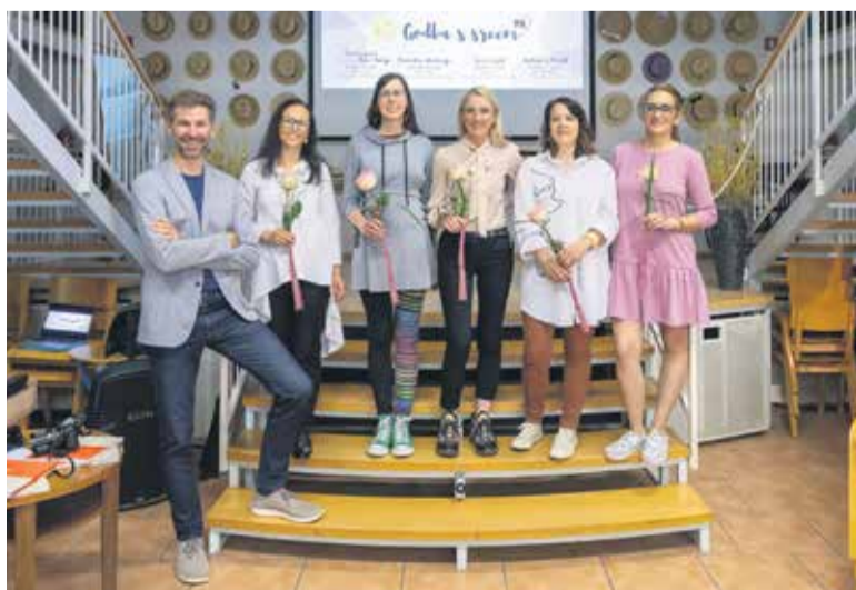
Srčni pogovori se bodo v Slamninarskem muzeju nadaljevali v septembru.