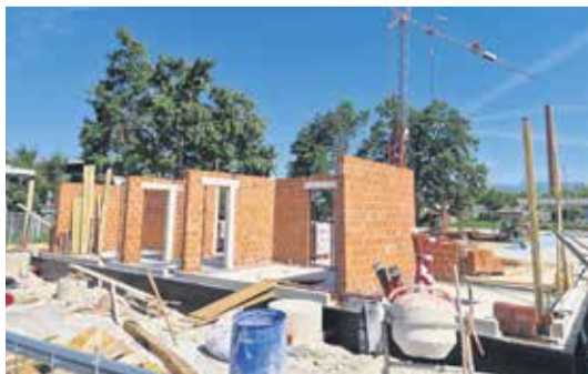
Delo na ploščadi v Športnem parku

izvaja podjetje Resal, d. o. o., končana bodo predvidoma do septembra letos.