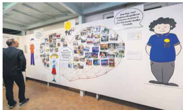
Razstava Izven okvirja je v Slamninarskem muzeju na ogled do septembra.

Med drugim se je v zadnjem desetletju naše društvo z resnostjo lotilo godbenega korakanja. Začeli smo z osnovami, majhnimi detajli, ki ogromno pripomorejo k podobi godbe v gibanju. Ravne vrste, strumen korak, usklajeno dviganje in spuščanje inštrumentov – z vsem tem se sreča vsak naš novinec. A tu se naše ambicije ne končajo. Z izobraževanjem predvodnikov, sodelovanjem s koreografi godbene figurlike in predvsem z ogromno vaje smo dodelali svoj 'show program', s čimer smo si od-