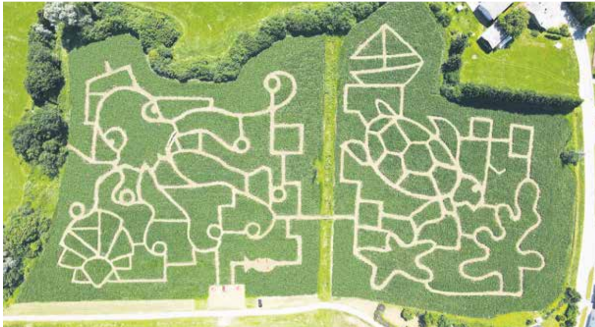
Labirint Koruzni ocean na Krtini

Domžale so odlično izhodišče za kolesarjenje in pohodništvo. Naše mesto je obdano s čudovito naravo, ki ponuja številne poti za kolesarje in pohodnike. Kolesarske poti ob Kamniški Bistrici so priljubljene tako med rekreativnimi kolesarji kot tudi