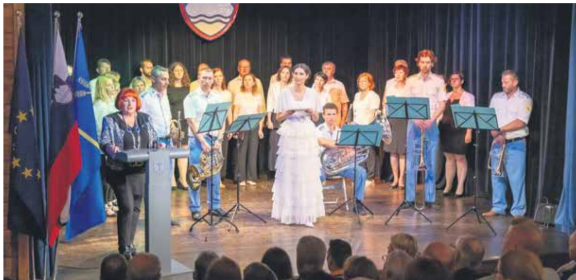
Osrednja občinska proslava ob dnevu državnosti