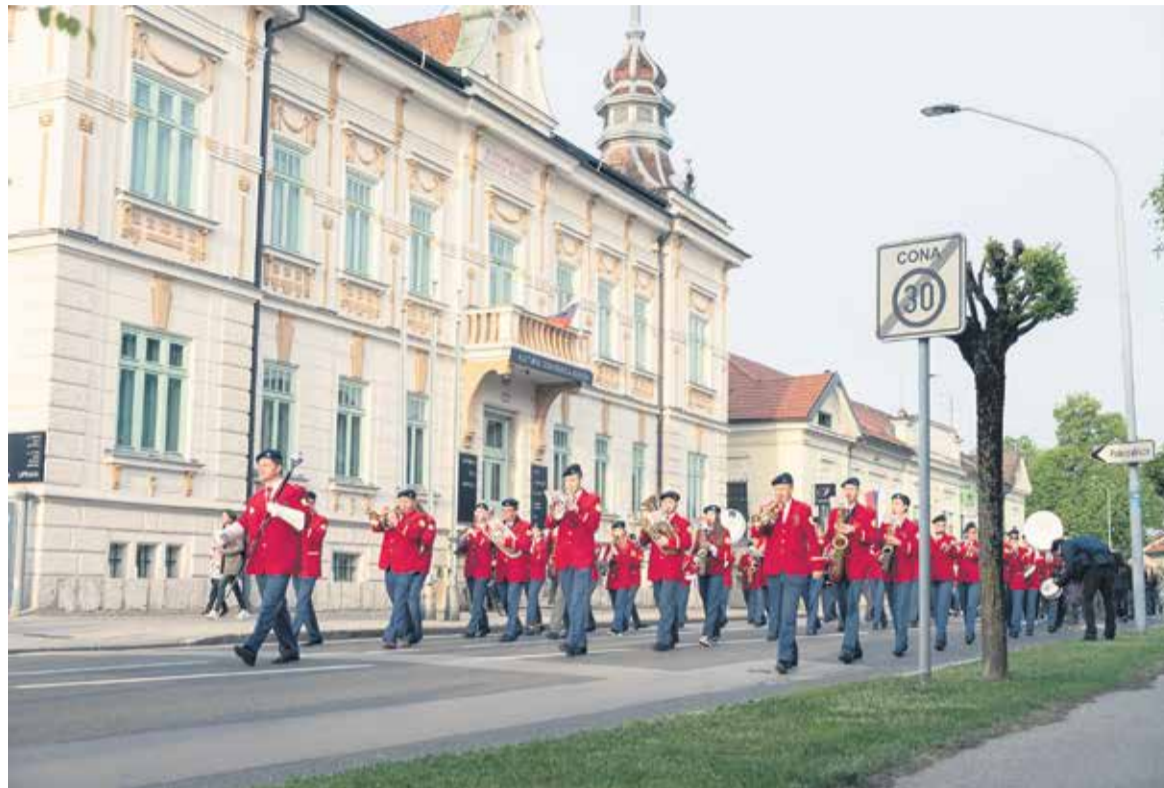
Tradicionalna prvomajska budnica

Avgusta 2022 smo se odpravili v Dalmacijo, kjer nas je gostila godba Gradska glasba Opuzen . Našli smo čas za vožnjo po reki Neretvi, zvečer pa kot gostje nastopili na slavnostnem koncertu prijateljske godbe. Sledil je koncert v Kleku, kjer smo zabavali domačine in turiste iz različnih