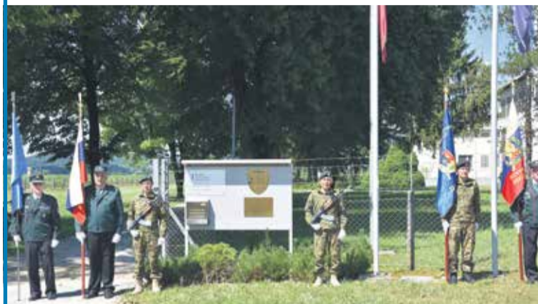
2. julija 2024 je bila spominska slovesnost ob obletnici raketiranja Radio-oddajnega centra Domžale.