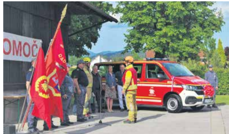
Na prevzemu novega vozila PGD Radomlje