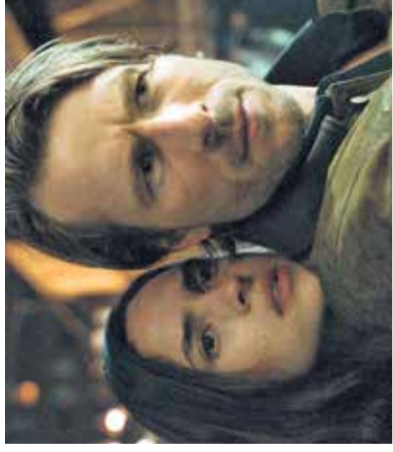
Film: Naključni morilec Mestni kino Domžale, 2. junija