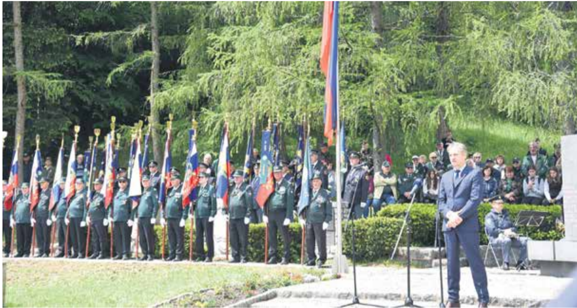
Dan veteranov na GEOSS-u

Živimo v združeni Evropi in zvezi NATO, ki nam nudi nekakšen varnostni ščit pred nemirnim svetom, polnim vojnih žarišč.