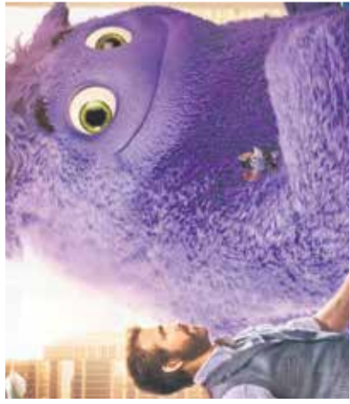
Film: IP Mestni kino Domžale, 2. junija