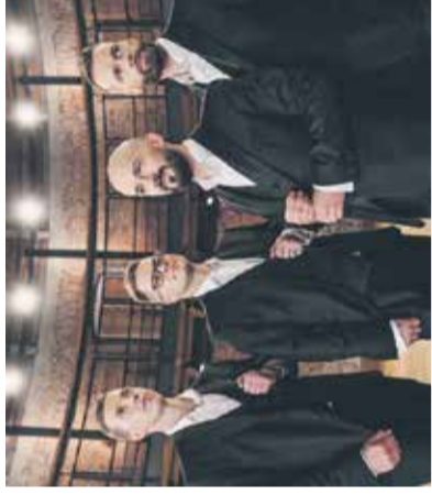
Koncert: Kvatropirici Poletno gledališče Studenec, 7. junija