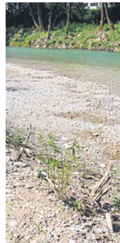
Na obrežju je zasajenih več kot 350 vrb.

Poskušali smo čim hitreje sanirati stanje, da preprečimo še večjo katastrofo, zato smo se odločili za sajanje potaknjencev vrb, ki tudi sicer rastejo ob bregovih Kamniške Bistrice.