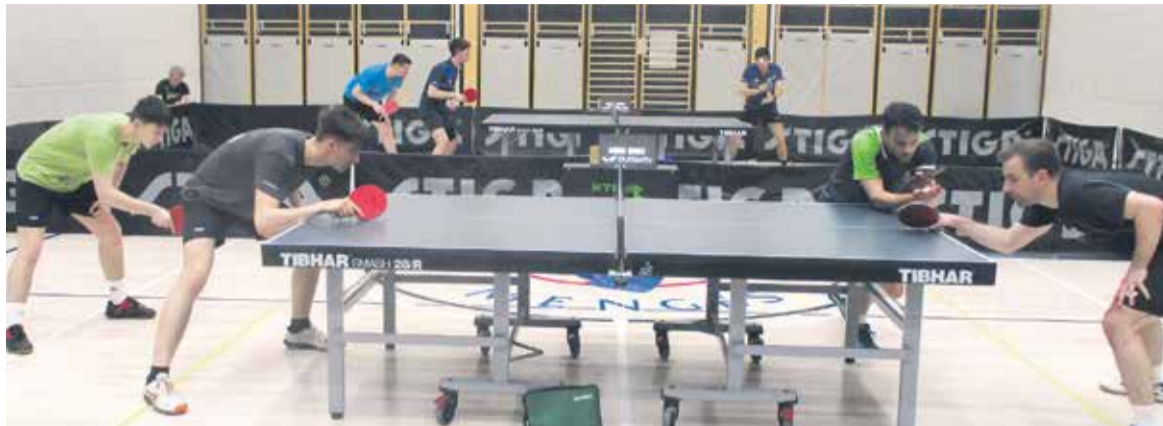
Ogrevanje naše ekipe pred zadnjim ligaškim dvobojem v tej sezoni.