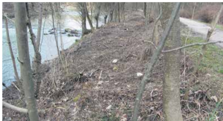
Po poplavah je ostalo še veliko rastlinja, ki pa je bilo pozneje odstranjeno in predelano v lesno maso.