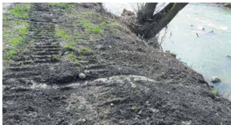
Ob sanaciji s težko mehanizacijo so brežine še dodatno uničevali.

jo potem 'kao' utrdili in vgrajevali v brežine. Jasno je, da bo ob prvih visokih vodah ta material reka odnesla; ob tem pa naj bi se pokazala 'potreba', da se reka zabetonira v še en nov kanal.