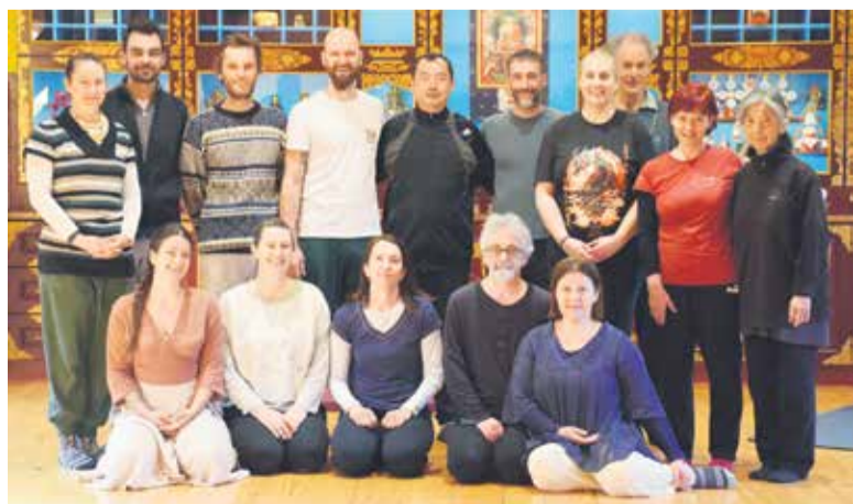
Prvi mednarodni Zhineng Qigong kamp Slovenija v organizaciji Društva Leteča želva

BESEDILO IN FOTO: ANDRAŽ PURGER DRUŠTVO LETEČA ŽELVA