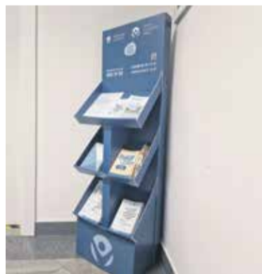
Varuhov kotiček najdete v predverju občinske stavbe.