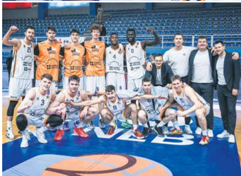
Sicer skozi šivankino uho, a uspelo je – končnica Lige ABA 2 je tu!