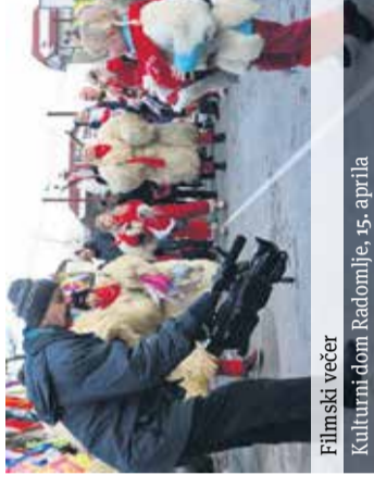
Filmski večer Kulturni dom Radomlje, 15. aprila