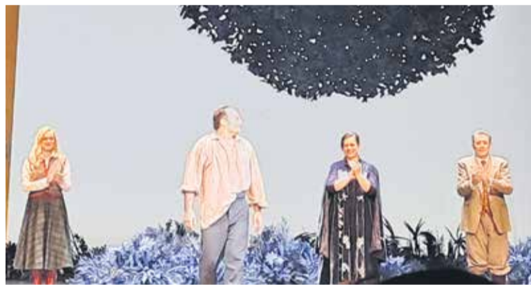
Werther v Ljubljani