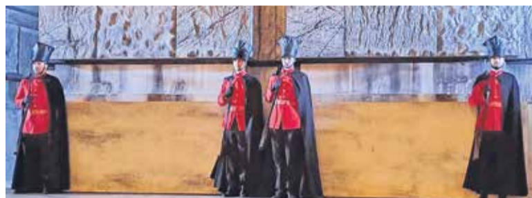
Nabucco v Zagrebu