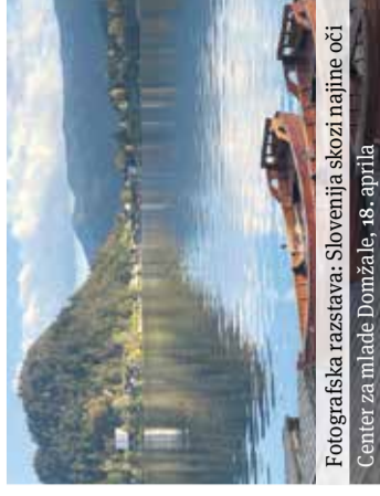
Fotografska razstava: Slovenija skozi najine oči Center za mlade Domžale, 18. aprila