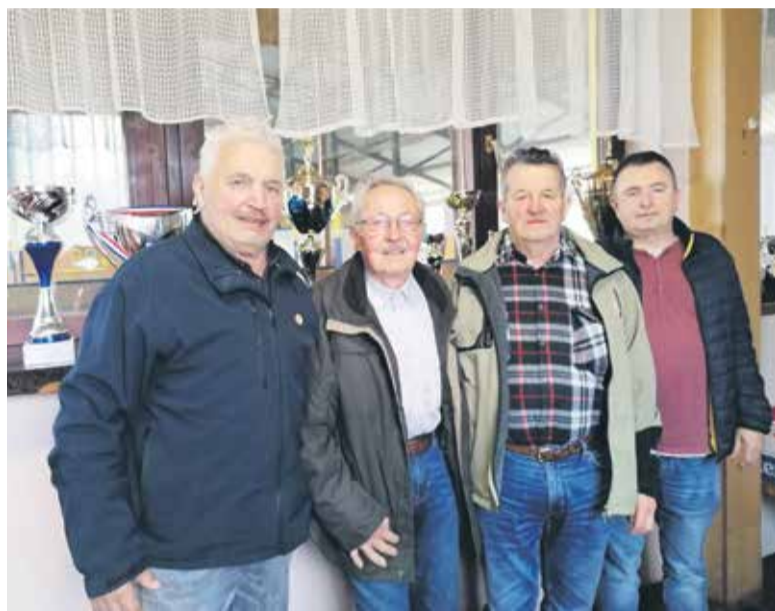
Sodelujoči v pogovoru Tako je bilo nekoč.

Tudi v aprilu bo precej mednarodnih tekmovanj; od njih bi omenil nekatera, ki bodo v Evropi. Tekmovanja bodo torej v Varaždinu (Hrvaška), Düsseldorfu (Nemčija), Podgorici (Črna gora), Havirovu (Češka), Luksemburgu, Spaju (Belgija) in Metz (Francija). Spomnil pa bi vas še na 23. april, ki je opredeljen kot svetovni dan namiznega tenisa in na ta dan bodo po vsem sve-