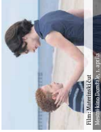
Film: Materinski čut Mestni kino Domžale, 1. aprila