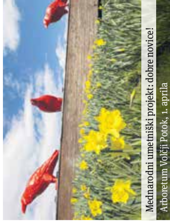
Mednarodni umetniški projekt: dobre novice! Arboretum Volčji Potok, 1. aprila