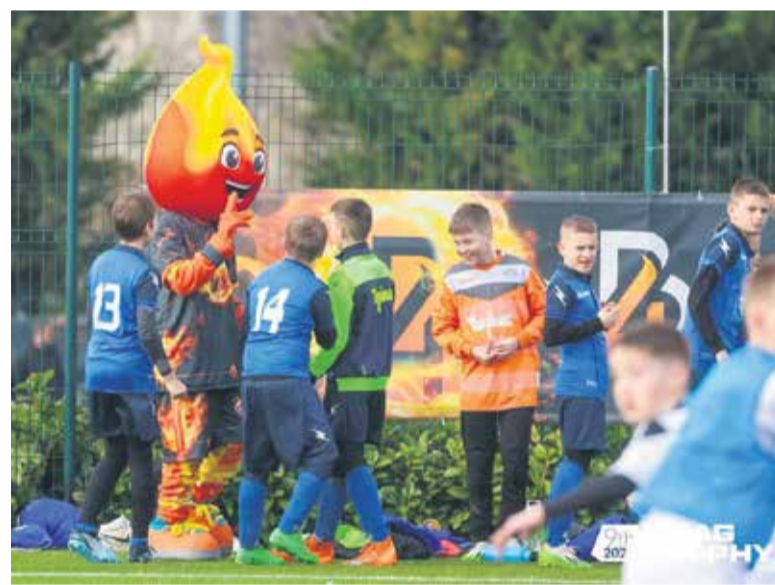
Medtem ko članska ekipa pridno nabira prvenstvene točke, so selekcije med U8 in U12 marca na močnem mednarodnem turnirju Umag Trophy 2024 nabirale pomembne izkušnje v nogometnem razvoju.