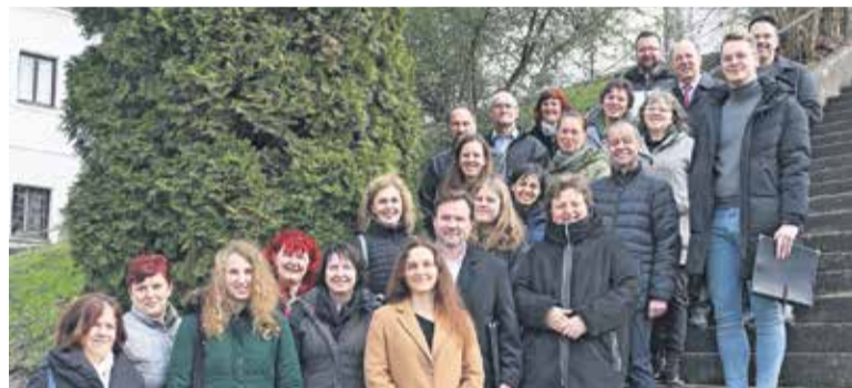
Spominska sveta maša na Homcu