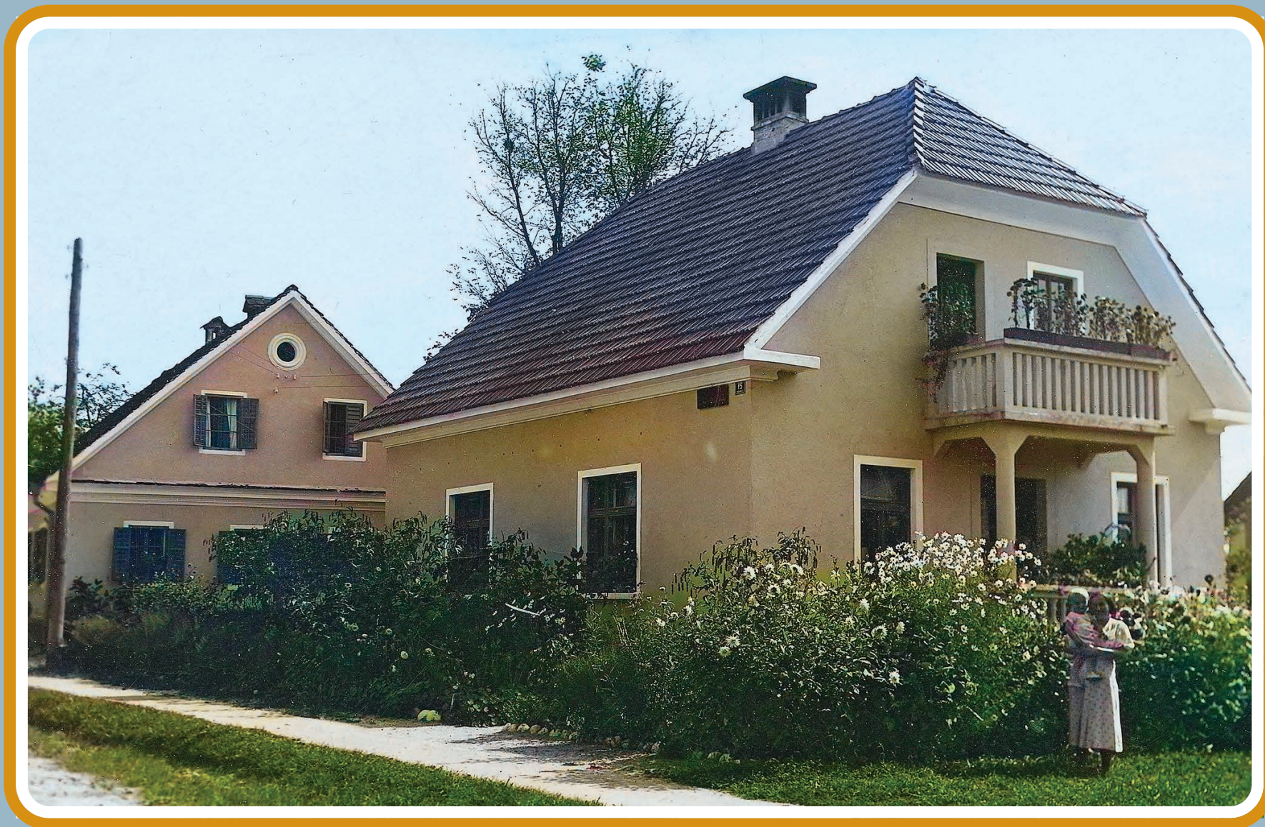
Drolčeva hiša nekoč.