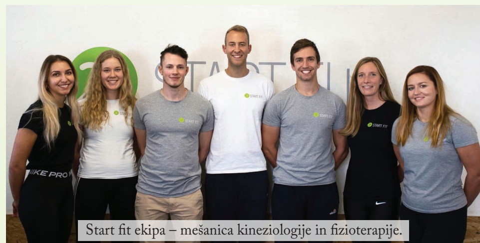
Start fit ekipa – mešanica kineziologije in fizioterapije.

Za več informacij si lahko ogledate naš youtube kanal START FIT – KINEZIOLOŠKI CENTER, kjer tedensko objavljamo informacije s področja rehabilitacije.