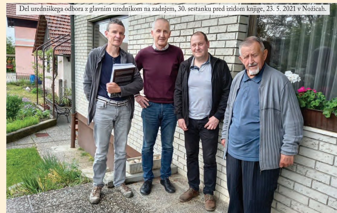
Del uredniškega odbora z glavnim urednikom na zadnjem, 30. sestanku pred izidom knjige, 23. 5. 2021 v Nožicah.