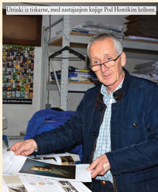
Utrinki iz tiskarne, med nastajanjem knjige Pod Homškim hribom.

Oziranje v preteklost nam ponuja spoznanje, da cenimo pot naših prednikov, vzbuja samozavest ter nas usmerja v razmišljanja o prihodnosti. Zbornik, ki je pred vami, med drugim poudarja prav ta odnos, da se v generacijah, ki prihajajo, vzbudi čut o zavedanju bogate prehojene poti naših prednikov. Vsebino smo nadgradili s spoznanjem, da je znanje moč, kar je bila vodilna misel pri našem ustvarjanju.