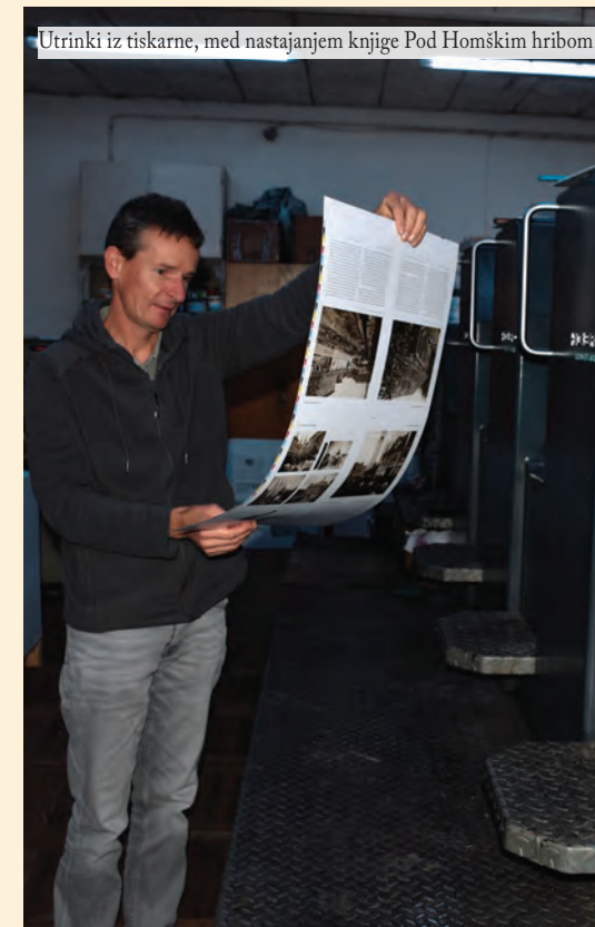
Utrinki iz tiskarne, med nastajanjem knjige Pod Homškim hribom.

Zanimiva zgodovinska publikacija, ki je pred vami, ni le naš dolg preteklim generacijam. Predstavlja popotnico vsem, ki jo bodo prebrali ali samo bežno pregledovali obsežno fotografsko dokumentacijo, s katero sta zaznamovana čas in prostor domovanja homškega osamelca, okoli katerega reže strugo vodna os Kamniške Bistrice s svojimi nekdaj življenjsko pomembnimi mlinščicami.