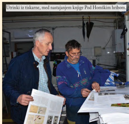
Utrinki iz tiskarne, med nastajanjem knjige Pod Homškim hribom.

Oziranje v preteklost nam ponuja spoznanje, da cenimo pot naših prednikov, vzbuja samozavest ter nas usmerja v razmišljanja o prihodnosti. Zbornik, ki je pred vami, med drugim poudarja prav ta odnos, da se v generacijah, ki prihajajo, vzbudi čut o zavedanju bogate prehojene poti naših prednikov. Vsebino smo nadgradili s spoznanjem, da je znanje moč, kar je bila vodilna misel pri našem ustvarjanju.