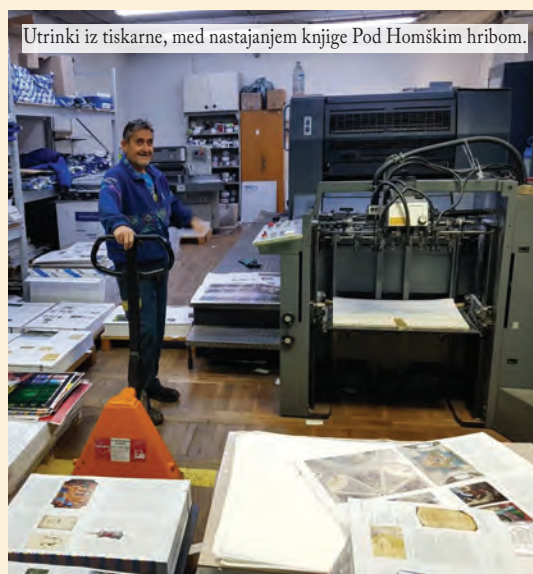
Utrinki iz tiskarne, med nastajanjem knjige Pod Homškim hribom.

Nepredvidljivi dogodki sodobnega časa so posegli tudi v nastajanje našega knjižnega dela in nam spremenili načrte, prestavili potek ter program izida. Zaradi pojava virusne epidemije, ki je zajela celotni svet, so se z zdravstvenimi zapletmi in posledičnimi ukrepi začasno prekinili