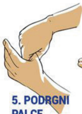
5. PODRGNI PALCE