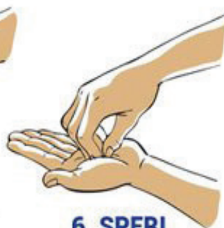
6. SPERI IN OBRISI

Umivanje in razkuževanje rok je pomemben ukrep za zaščito pred koronavirusom, saj lahko prepreči prenos virusa iz okolice v gospodinjstvo.