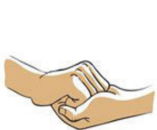
4. PODRGNI KONICE PRSTOV