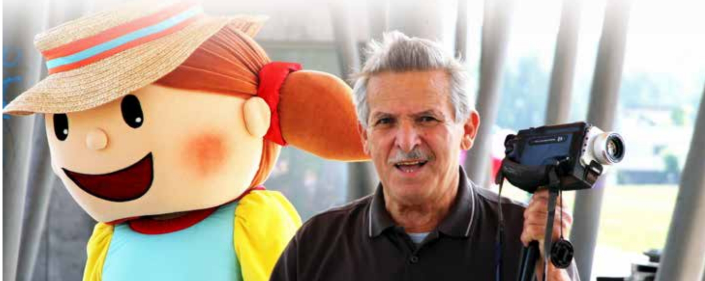
Foto kino in video klub MAVRICA se je letos kot prvo med vsemi kulturnimi društvi na območju občine Domžale predstavilo v Knjižnici Domžale in sicer v 18. oktobra. Predstavitve društev so potekale na pobudo in v organizaciji domžalske izpostave Javnega sklada za kulturne dejavnosti RS (JSKD).

Člani Foto sekcije so se predstavili z razstavo fotografij, ki so jih posneli na letošnjem dogodku v Češminovem parku in ji dali naslov »Ples domžalskih maskot, vrtničkarjev in fotografov« ter s priložnostno improvizirano dokumentarno razstavo o mavriških klubskih dejavnostih »skozi čas«, o katerih je novinar nekoč zapisal, da mavrica v tem primeru pomeni »mavrico številnih aktivnosti in dejavnosti«.